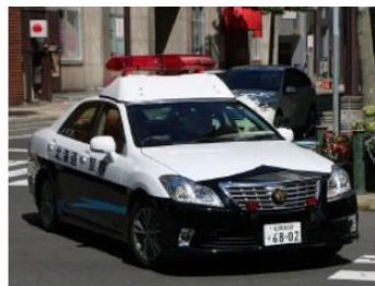
罰則等の基礎知識