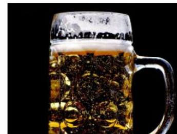
アルコール豆知識