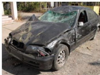
プロドライバーの飲酒運転による交通事故件数